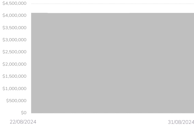
Histórico de Patrimonio